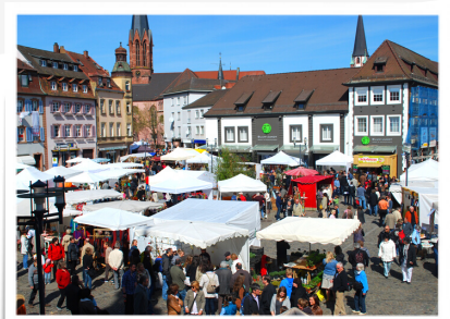
UNTER LEUTEN Emmendinger Märkte