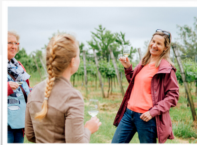
KULTUR ERLEBNIS Themenführungen